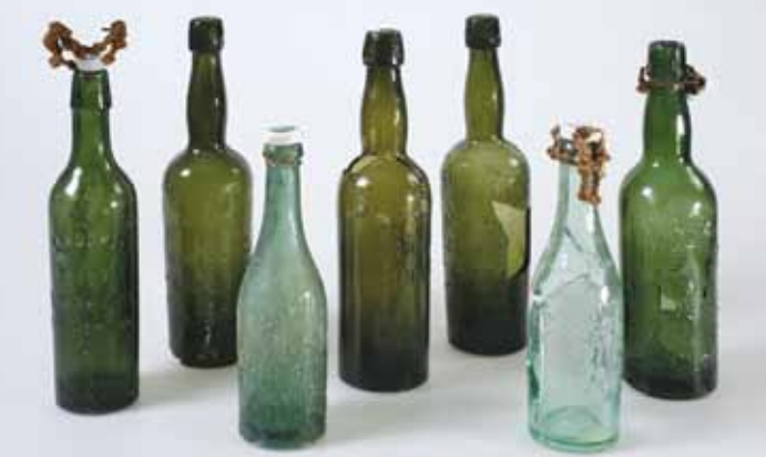
Aspach, lieu-dit Lerchenberg (Haut-Rhin) : bouteilles en verre provenant des dépotoirs de tranchées allemands de la Première Guerre mondiale (Doc. M. Landolt, PAIR. Photo : C. Leprovost)