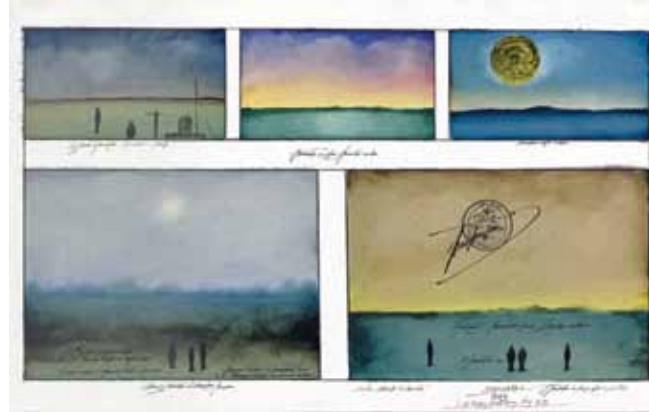
Saul Steinberg, Five Postcards , 1969 Dessin à la plume, aquarelle et tampon sur papier Collection Joffe © The Saul Steinberg Foundation / ARS, ADAGP Paris 2009