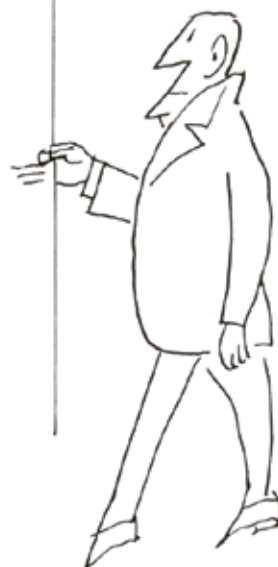
Saul Steinberg, Parade (détail), 1952 Collection M. et Mme Niemann. © The Saul Steinberg Foundation/ARS, ADAGP Paris 2009. Photo: M. Bertola

Brochure janv / fév / mars 2010 Direction : Joëlle Pijaudier-Cabot Service Communication : Alexandre Kirstetter, Julie Barth et Cathy Letard Conception graphique : Rebeka Aginako Imp. int. C.U.S. - déc 2009