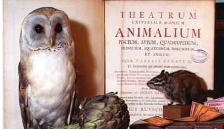
Animal museum de Marie Fréring et Philippe Poirier. Production Bixfilms.

Au mois de mars 2010 le Musée Tomi Ungerer sera fermé en raison du démontage de l'exposition « Saul Steinberg. L'écriture visuelle » et de la mise en place de l'accrochage n°7 de la collection permanente du musée. La nouvelle présentation proposée au public à partir du mois d'avril est exceptionnelle : en effet, le premier étage du musée va être entièrement consacré aux années canadiennes de Tomi Ungerer (1971-1975) et présentera les dessins originaux des deux ouvrages qui témoignent de cette période, Slow Agony et Nos années de boucherie , en regard avec des dessins naturalistes des siècles derniers. C'est la première fois que l'un des aspects fondamentaux de son œuvre graphique, le dessin d'observation, avec lequel l'artiste a renoué après son séjour new-yorkais, est montré au Musée Tomi Ungerer.