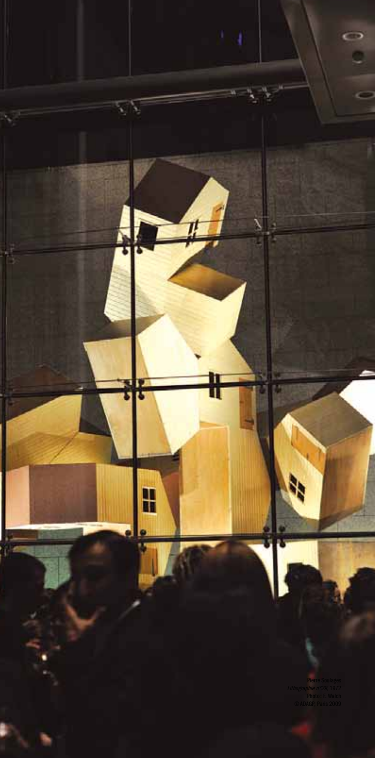
Pietro Savinio Litographie n°29, 1912 Photo: T. Wach © ADAGP, Paris 2009